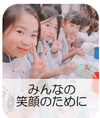
みんなの笑顔のために