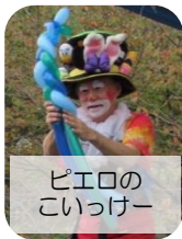
ピエロのこいつけー

スタッフの中に栄養士・看護師・調理師がいること、行政のきめ細かい対応のおかげで、安全・安心に運営ができています。活動を充実させるため、2019年8月に法人化。持続可能な子ども食堂を目指し、地域活性化や子育て支援につなげていきたいと考えています。